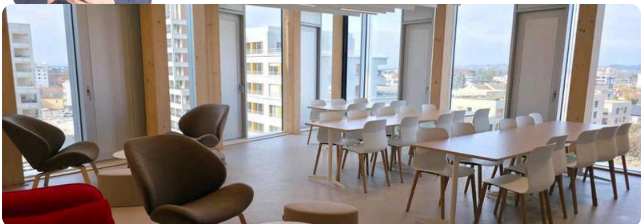
Espace détente formateur