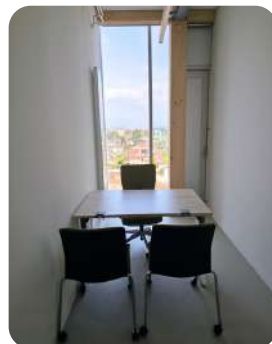
Bulle de RDV