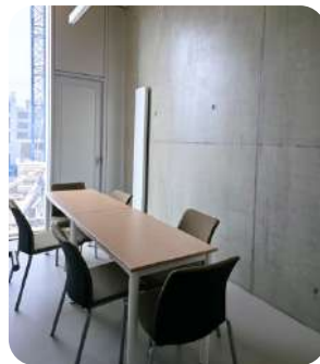
Bulle de travail